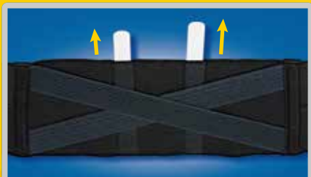
背面クロスベルト&ボーン

背面のクロスベルトがボーンを押し込み、腰全体をサポートします。ボーンを取り外すことで、よりフィット感が高まります。